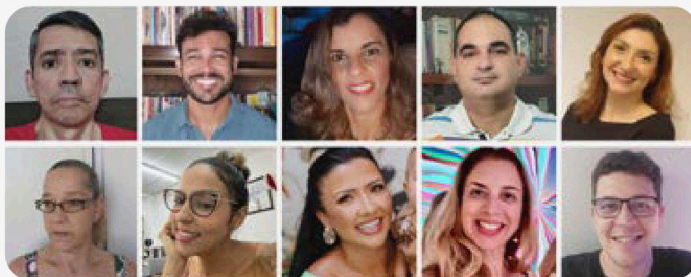
Fig.6 - Voluntários do projeto Eleitor do Futuro de 2023