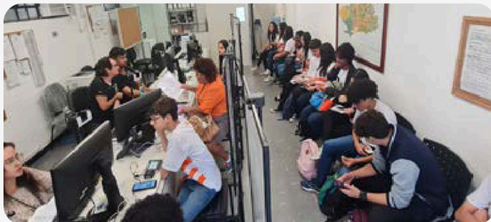
Fig. 12 - No Visitas Ao TRE, os estudantes também podem fazer alistamento na Central de Atendimento

Criado pela Escola Judiciária Eleitoral do Rio de Janeiro, o projeto é voltado para jovens universitários e estudantes de Ensino Médio. Promove visitas dos estudantes à sede do TRE-RJ e conversas sobre cidadania digital, desinformação e eleições. Há também a participação em uma eleição simulada e acompanhamento de uma sessão de julgamento da Corte Eleitoral fluminense, além de uma visita guiada ao Museu do TRE-RJ. Os estudantes podem ainda fazer alistamento eleitoral na Central de Atendimento ao Eleitor (CAE-Sede) que funciona no Tribunal.