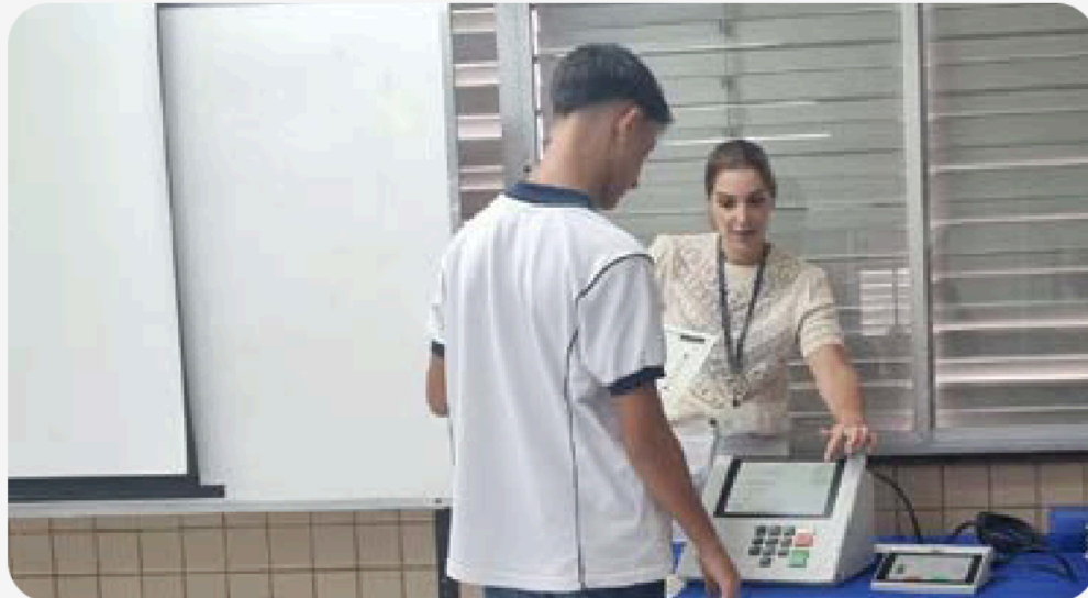
Fig.7 - TRE Vai À Escola sendo aplicada em uma escola na Taquara

Criado em 2017 pelo TRE-RJ, o projeto tem como modelo o Eleitor do Futuro, mas as palestras são realizadas pelos Juízes Eleitorais fluminenses, todos voluntariamente. No ano passado, foram 160 ações que envolveram 12.024 estudantes em todo o estado do Rio de Janeiro.