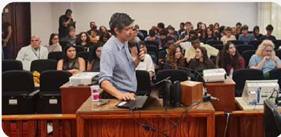
Fig.4 - Estudantes do Centro Educacional Anísio Teixeira assistem à palestra sobre desinformação