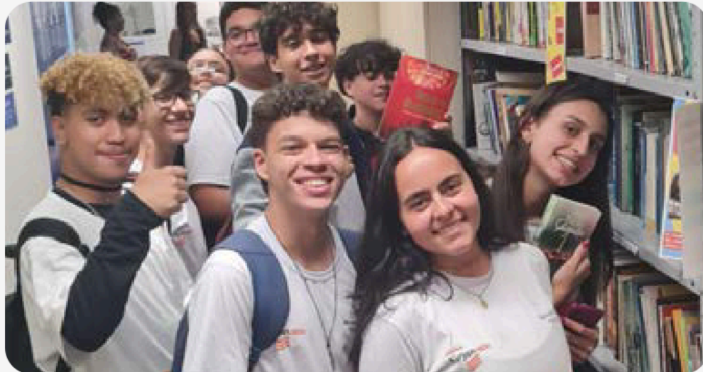
Fig.11 -Alunos da Firjan fazem visita guiada ao museu e a biblioteca do TRE-RJ

Criado pela Escola Judiciária Eleitoral do Rio de Janeiro, o projeto é voltado para jovens universitários e estudantes de Ensino Médio. Promove visitas dos estudantes à sede do TRE-RJ e conversas sobre cidadania digital, desinformação e eleições. Há também a participação em uma eleição simulada e acompanhamento de uma sessão de julgamento da Corte Eleitoral fluminense, além de uma visita guiada ao Museu do TRE-RJ. Os estudantes podem ainda fazer alistamento eleitoral na Central de Atendimento ao Eleitor (CAE-Sede) que funciona no Tribunal.